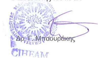
Δρ. Γ. Μπραουράκης